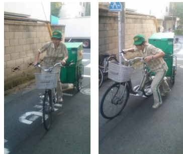
▼電動アシスト自転車を利用した運送