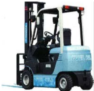
▼燃料電池フォークリフト